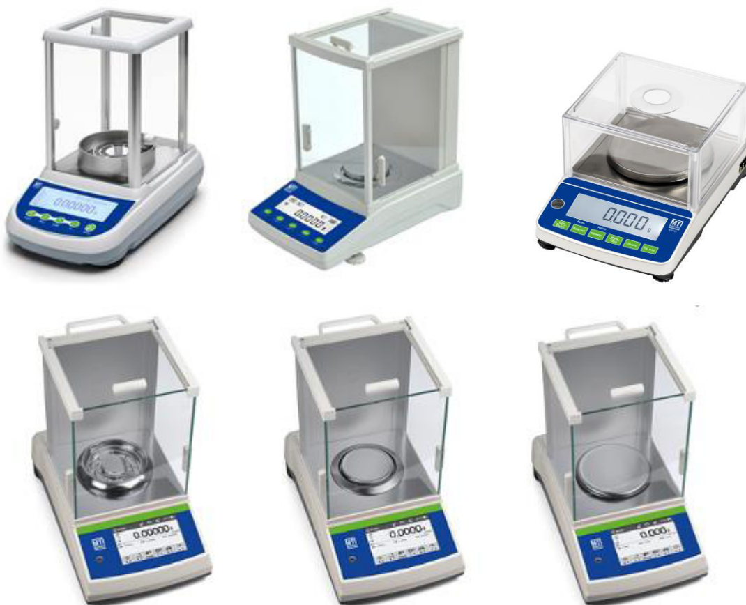
Рисунок 1 — Общий вид весов с действительной ценой деления от 0,01 мг до 1 мг

Общий вид весов показан на рисунках 1, 2.