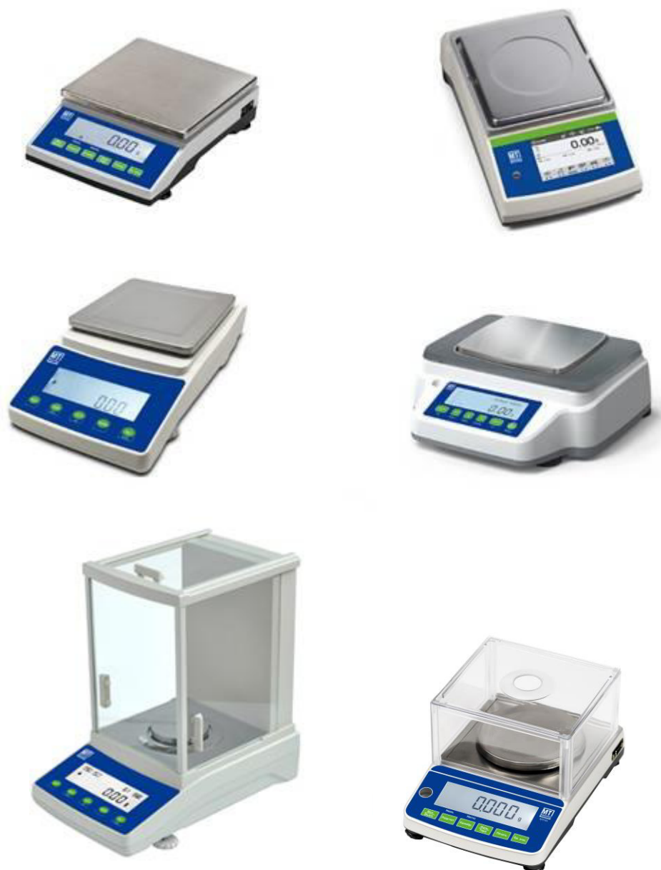
Рисунок 2 — Общий вид весов с действительной ценой деления от 0,01 г до 0,1 г